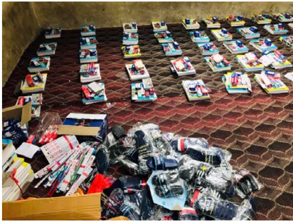
livraison des kits scolaires