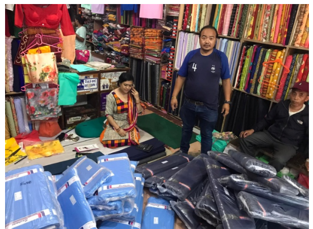
Achat des machines, tissu et petit matériel