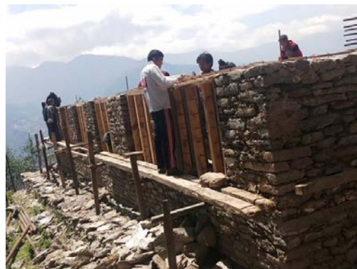
Le bâtiment en cours de construction