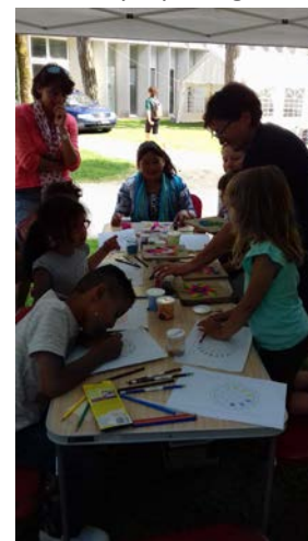
L'atelier Mandalas et écriture Népalaise