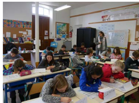
Les écoliers de Presle travaillent sur leur livret