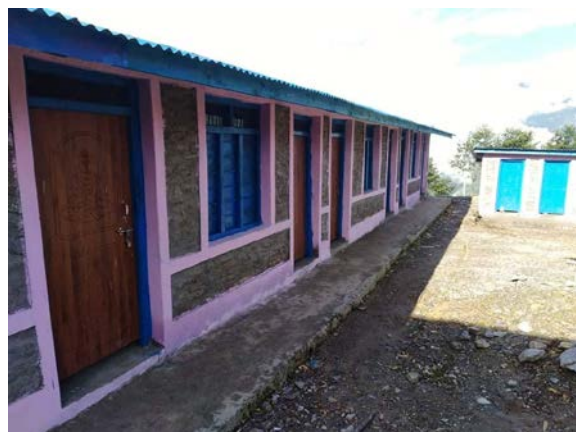
Et l'état actuel avec les toilettes