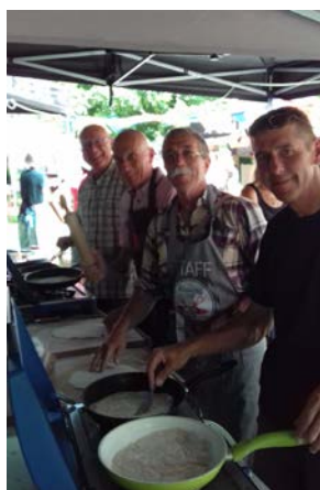
La partie restauration