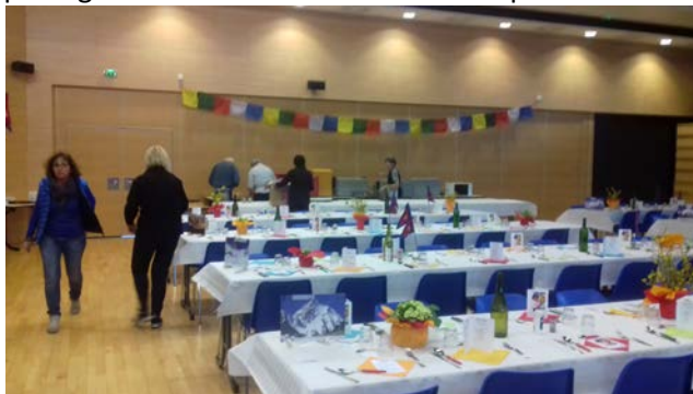
Mise en place des tables

Le 10 mars 2018, s'est tenu à l'Atrium de Gilly sur Isère, le repas népalais annuel avec 200 convives qui ont pu déguster le traditionnel Dal Bhat et profiter des diverses animations.