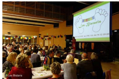
Le mot d'accueil de la Présidente

Entre l'apéritif et les différents plats, les convives ont apprécié les films concoctés par Les Bistaris sur la reconstruction des écoles, l'ambiance d'un trek et le Mustang, région magnifique du Népal