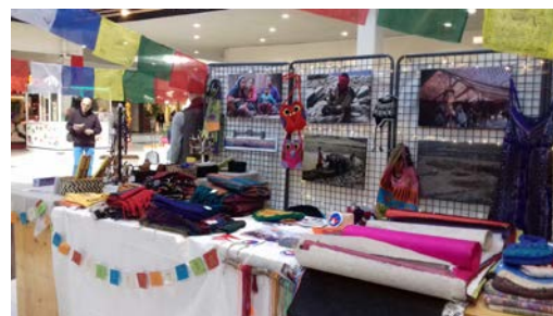
Une partie du stand Népal

Nous avons pu présenter, animer et aussi procéder à la vente d'objets de l'artisanat Népalais.