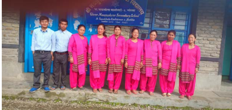
Les enseignants et enseignantes avec leurs nouvelles tenues

Nous pouvons les féliciter pour la qualité du travail accompli et nous nous réjouissons de les avoir aidées dans ce nouveau parcours professionnel.